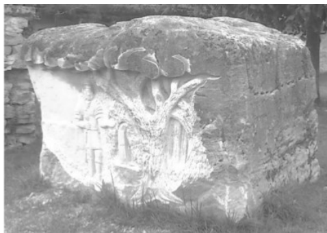
Pierre trouvée dans le Fiarupt, taillée par un tailleur local, visible dans le petit parc Artéria.